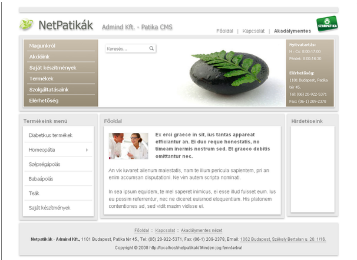
5.1 ábra A nyilvános felület

A Nyilvános felület kezdetben a következőképpen néz ki: